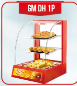
GM DH 1P