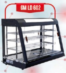
GM LD 602