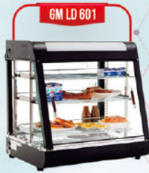
GM LD 601