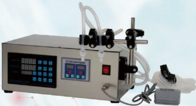
GFK - 280/2