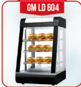
GM LD 604

Display warmer ini juga berfungsi untuk memajang produk makanan yang diujakan. Mesin ini memiliki kaca yang transparan, sehingga mampu menjangkau penglihatan konsumen untuk memilih produk makanan lebih baik