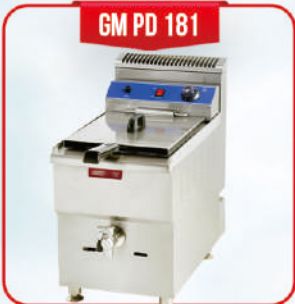
GM PD 181

Deep Fryer adalah mesin untuk menggoreng berbagai bahan makanan. Selain itu juga penggunaan tempat penggorengan berbentuk bak celup yang akan memberikan kecepatan proses penggorengan stabil dan merata