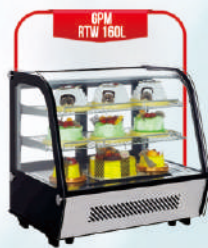
GPM RTW 160L