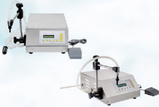
GFK - 160