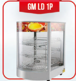
GM LD 1P