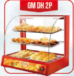
GM DH 2P